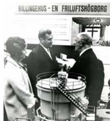
Arne & Maja Sandberg med Gustav VI Adolf under invigningen av Billingehus 1970

När invigningen stundade år 1970 hade man byggt både konferensanläggning, hotell, bad, tennisbanor, fotbollsplan, kyrka, skidbacke med lift samt flera motionsspår för löpning och längdskidor.